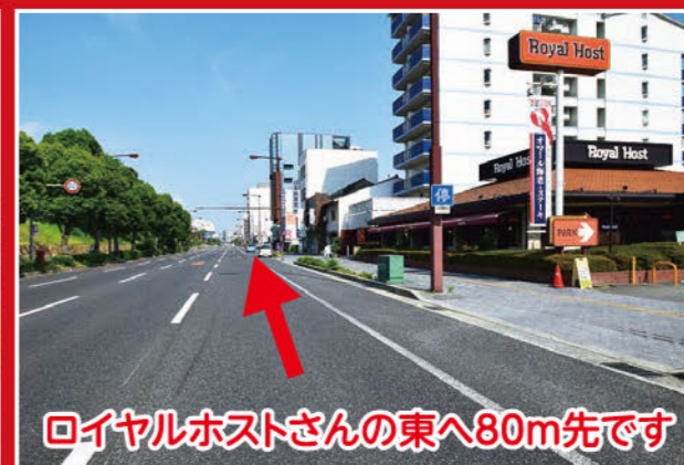
ロイヤルホストさんの東へ80m先です