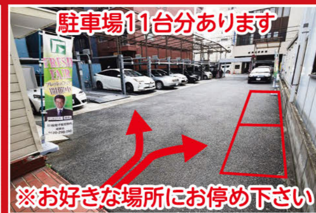
駐車場11台分あります