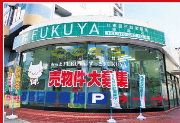
駐車場への進入路